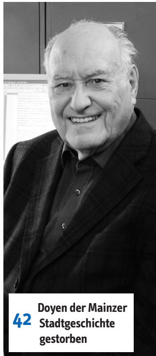
42 Doyen der Mainzer Stadtgeschichte gestorben